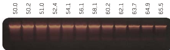
Abb. 1: Temperaturgradienten - RT-PCR eines Genfragmentes von Sus scrofa Arginase I. Reverse Transkription erfolgte mit NG dART Reverse Transkriptase aus totaler RNA (isoliert aus Lebergewebe mit dem GeneMatrix Universal RNA Kit, Best. Nr. E3598). PCR-Amplifikation mit OptiTaQ DNA Polymerase. Amplikonlänge: 1137 bp.